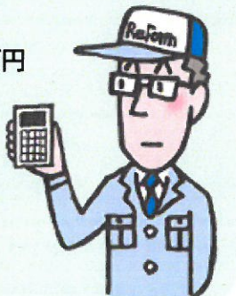
リフォーム事業者

※上記費用は工事規模により異なります。 詳しくはリフォーム事業者にご確認ください。